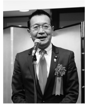
川内博史衆議院議員 (立憲)