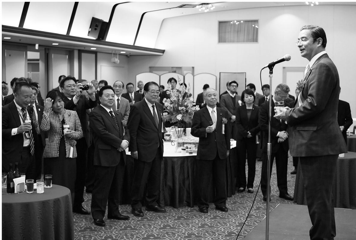
全国環整連の発展を祈念し乾杯した