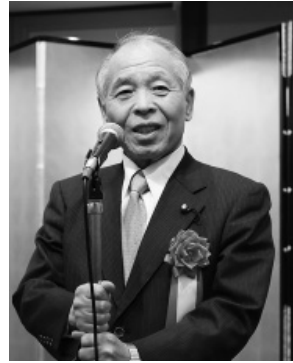
鈴木宗男代表 (新党大地)