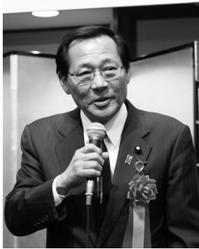
小島敏文衆議院議員 (自民)