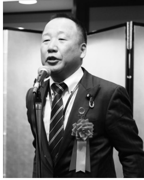
大島九州男参議院議員 (国民)