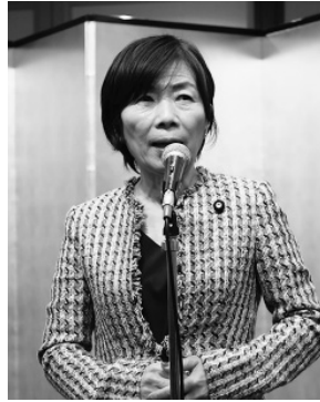
森ゆうこ参議院議員 (自由)