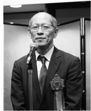
環境省・山本昌宏 環境再生・資源循環局長