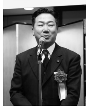
福山哲郎参議院議員 (立憲)