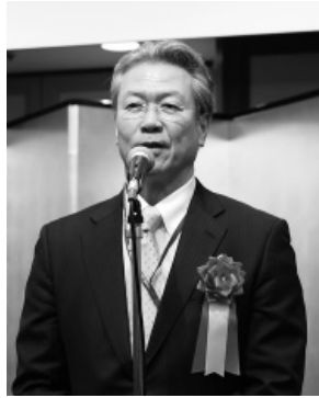
馬淵澄夫前衆議院議員 (現＝無所属・衆議院議員)