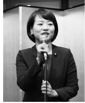
鈴木貴子衆議院議員 (自民)