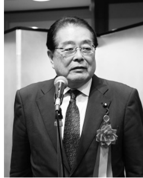
石田祝稔衆議院議員 (公明)