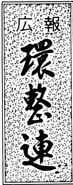
題字は斎藤邦吉先生書

発行所 昭和48年3月14日 厚生省環第171号認可 全国環境整備事業協同組合連合会 103-0027 東京都中央区日本橋2-9-1 竹一ビル4階 TEL (03) 3272-9939 FAX (03) 3272-9938