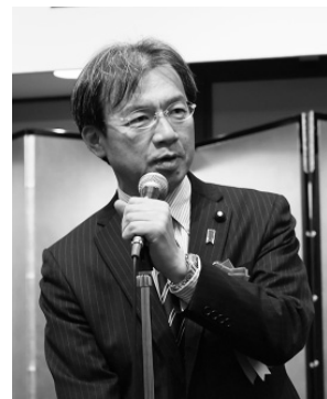
秋葉賢也衆議院議員 (自民)