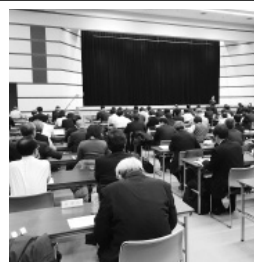
知として、6月22日付「建築物の解体時の残置物の取扱い」、12月16日付「廃エアゾール製品等の排出時の事故防止」が取り上げられた。

環境省は1月25日、省内で全国の都道府県および政令市等の担当者を対象にした「環境担当部長会議」を開催した(写真)。平成31年度予算の概要や近年の重要課題等について、環境省各部署から説明があり、一般廃棄物分野では昨年発出した「建築物の解体時等の残置物の取扱いについて」「廃エアゾール製品等の排出時の事故防止について」等の通知や、閣議決定された「廃棄物処理施設整備計画」の概要等について説明があった。