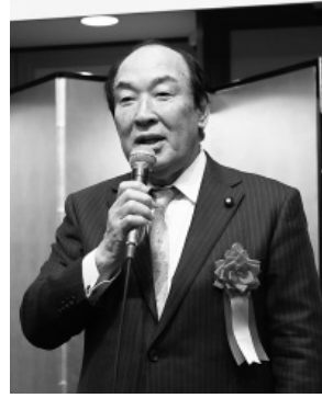
生方幸夫衆議院議員 (立憲)