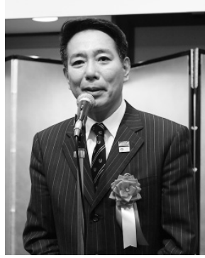
前原誠司衆議院議員 (国民)