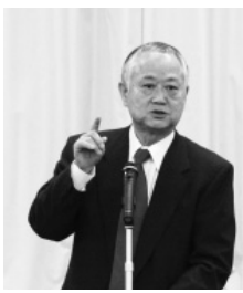
玉川会長(写真左)は「この研修会は法的拘束力が無いものだが、17年間続けている。中継の県民投票も政府は法的拘束力がないと言っているが、あろうがなかろうが大切なことは、良いことは続けるということ」「我々の目標は私も皆も共有しておく必要がある。本日のテキストの中に、平成28年度の浄化槽放流水の透視度が示されているが、透視度30度以上だったのは新設1390基を含め5万8944基だった。これが全部そのまま推移する

このうち3月4日は、岐阜県環境会館で開催され、玉川会長の講義で始まった。玉川会長(写真左)は「この研修会は法的拘束力が無いものだが、17年間続けている。中継の県民投票も政府は法的拘束力がないと言っているが、あろうがなかろうが大切なことは、良いことは続けるということ」「我々の目標は私も皆も共有しておく必要がある。本日のテキストの中に、平成28年度の浄化槽放流水の透視度が示されているが、透視度30度以上だったのは新設1390基を含め5万8944基だった。これが全部そのまま推移する