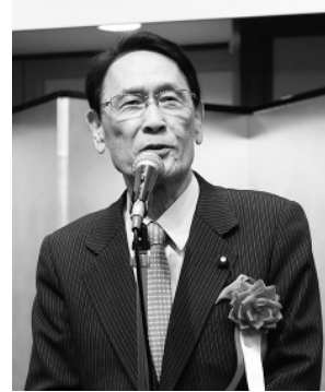
渡海紀三朗衆議院議員 (自民)