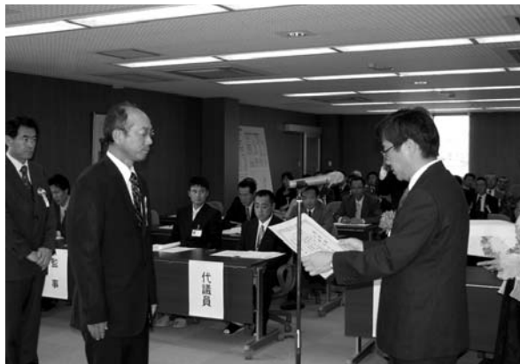
原 副知事から授与

受賞者のみなさん、まことにめでとうございました。今後とも一層のご活躍を期待しています。