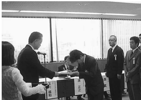
玉川会長から授与